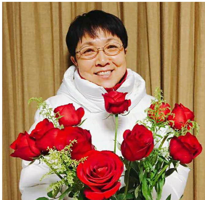
图：本期专访人物祥云老师